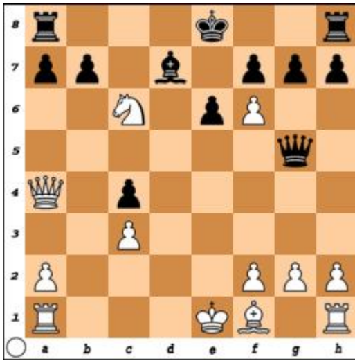
Diagrama 1. Mută albul. Cîștig