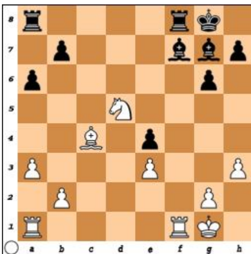
Diagrama 5. Mută albul. Cîștig