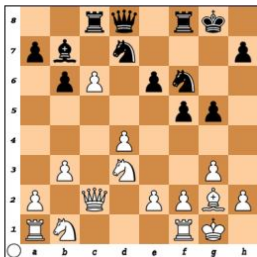
Diagrama 12. Mută albul. Cîștig