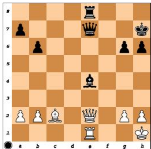
Diagrama 6. Mută negrul. Cîștig