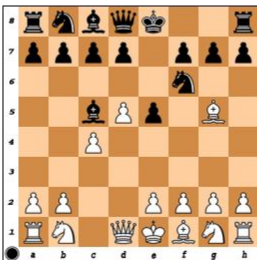
Diagrama 11. Mută negrul. Cîștig